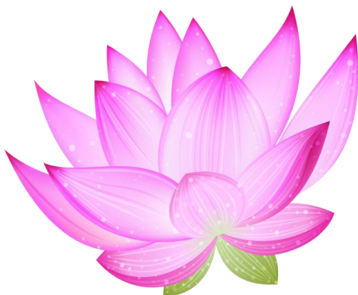
1 kwiatów lotosu