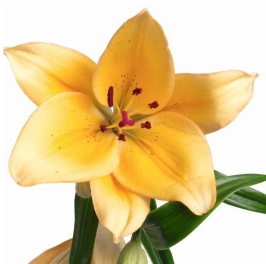
1 żółtych lilii

(zapisz w postaci sumy wyrażenia, w uproszczonej postaci).