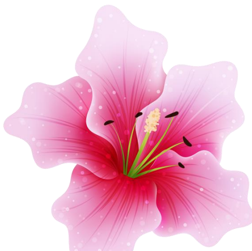
1 różowych lilii